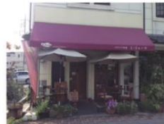
▼落ち着いた雰囲気の内店