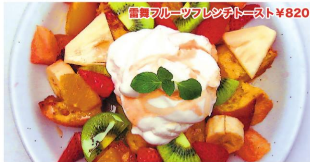
雷舞フルーツランチトースト ¥820

季節のフルーツをたっぷり使ったパフェ・デザート ケーキのお店です。ランチ: ¥520～ スイーツメニュー: ¥380