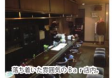
落ち着いた雰囲気のカフェ店内。