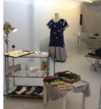
▲女性だけでなく男性も楽しめるラインナップ！