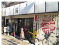
▲昭和の空気漂う外観