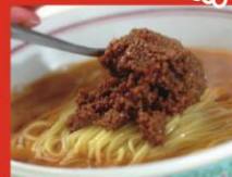
▲雷舞フェスコラボメニュー 辛きこと稲妻の如し ¥650

店長さんとのじゃんけんにも勝った方 コラボメニューが・・・ 通常¥650から ¥450に! 得