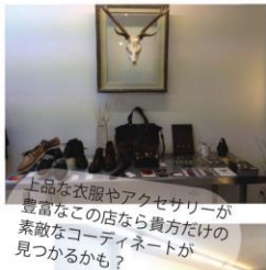
上品な衣服やアクセサリーが豊富なこの店なら貴方だけの素敵なコーディネートが見つかるかも？