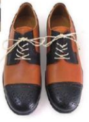
国内の職人に よって作られた 靴も多数展開。

雷舞限定割引 得 5%OFF!! ●有効期間：H26年9月19日～10月19日 ●ご利用の際に本誌をご提示ください ●お1人様1回限り有効 (ご利用済みの印をおつけいたします)