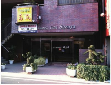
▲レンガ造りが特徴的なお店の外観

高崎で唯一、思い立ったら手ぶらでゴルフ！まちなかでいつでも 手ぶらでゴルフが楽しめます☆ Bar 営業時は各種お酒に 群馬県産のお肉や野菜を使った鉄板焼きの料理も堪能!! さらにカラオケだってできちゃう♪♪