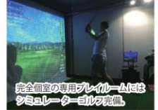
完全個室の専用プレイルームは タミヤレーダーゴルフ完備。