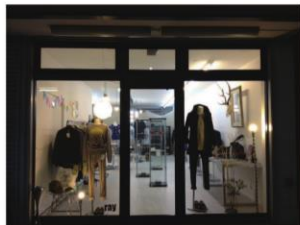
▲鹿が印象的な隠れ家的小店です

店内には洋服だけでなくアクセサリーやシューズも取りそろえられています。店内の雰囲気も落ち着いておりゆっくり商品を見たい人にお勧めです。