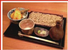
▲写真はイメージです